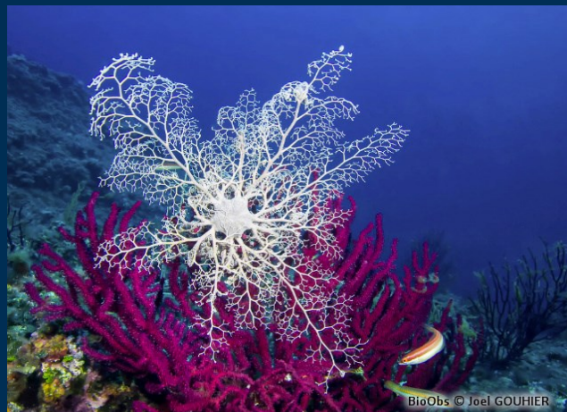
Richesse et variété