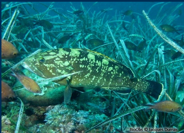
Diversité des substrats