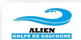
Tableau de bord du réseau ALIEN Golfe de Gascogne

Réseau porté par l'association "Les amis de BioObs" - Première observation le 11/11/1995