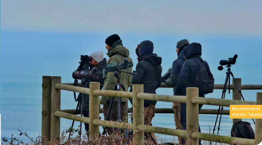
Recensement des mammifères marins "seawatch" avec le GMN