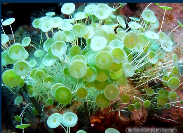
Habitats et espèces protégées