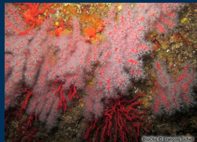
Coralligène, support de vie