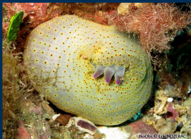
Crise du logement