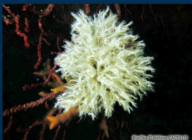
Voir, comprendre, aimer, respecter