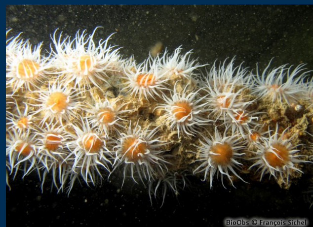
Epaves, oasis de vie