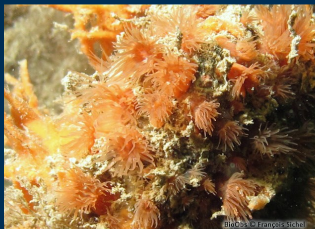
Le port, l'exotisme envahissant