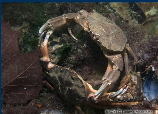
Des crustacés parfois enragés