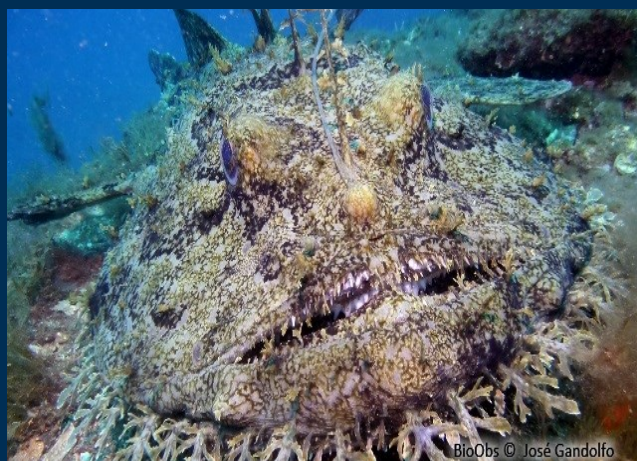
Richesse des tombants