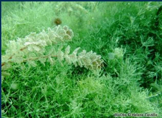
Tapis de plantes aquatiques