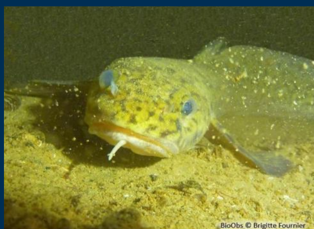
Voir, comprendre, aimer, respecter