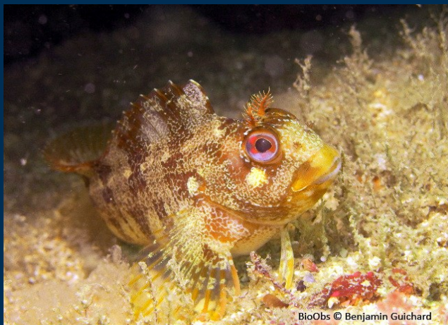
Diversité des substrats