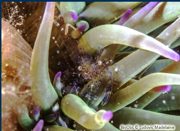
Richesse et variété